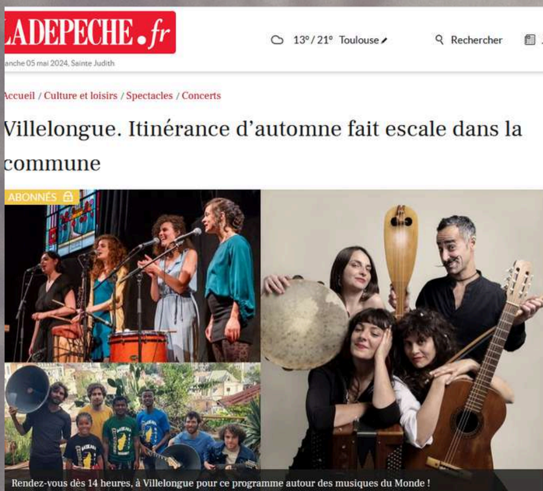
Article La Depeche