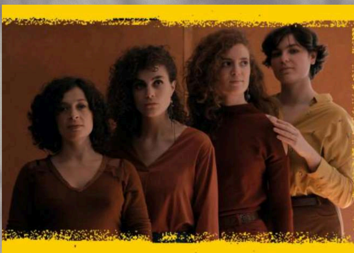
Interview Fréquence Luz